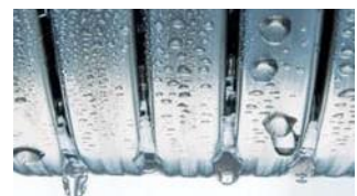
Nerūsējošā tērauda radiālais siltummainis

Nerūsējošam tēraudam ir izšķiroša nozīme. "Vitodens 050-W" galvenais elements ir korozijizturīgs nerūsējošā tērauda radiālais siltummainis. Tas efektīvi pārvērš izmantoto enerģiju siltumā. Un to papildina drošība, ko sniedz īpaši izturīgais, augstas kvalitātes nerūsējošais tērauds.