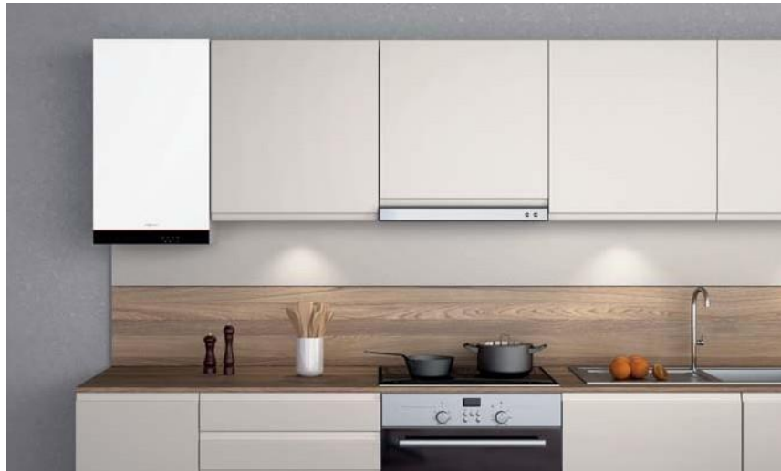
Pievilcīgā dizainā veidotais "Vitodens 050-W" krāsā Vitopearlwhite

Kompakti un efektīvi pie sienas montējamie kondensācijas tipa gāzes apkures katli ar īpaši pievilcīgu cenas un vērtības attiecību.