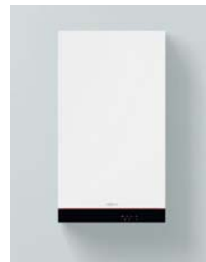
VITODENS 050-W (tips B0KA)

“Vitodens 050-W” ir pārbaudīts un apstiprināts ekspluatācijai ar dabasgāzi atbilstoši standarta EN 15502 noteikumiem. Nav nepieciešams veikt pārslēgšanu starp gāzes grupām E/LL/Lw/K.