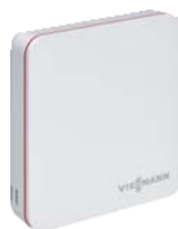
"ViCare" termostats lielākām ērtībām un darbības efektivitātei